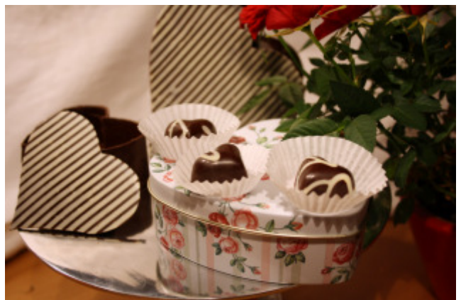
Herzförmige Pralinen vor dem Gießen weiß verzieren und in einer selbstgemachten Herzbonbonniere verschenken.

Hier sind einige Beispiele zu sehen, wie Muttertagspralinen auch aussehen könnten: