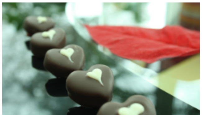
Marzipanherzen. Das Marzipan wurde mit etwas Rosenöl, Rosenlikör und Puderzucker vermengt.